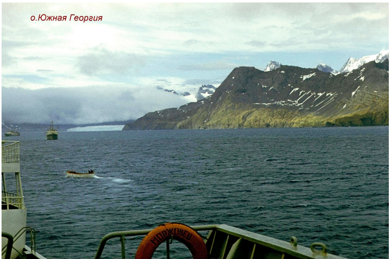
У острова Южный Георгия Фото – П. Деришева.