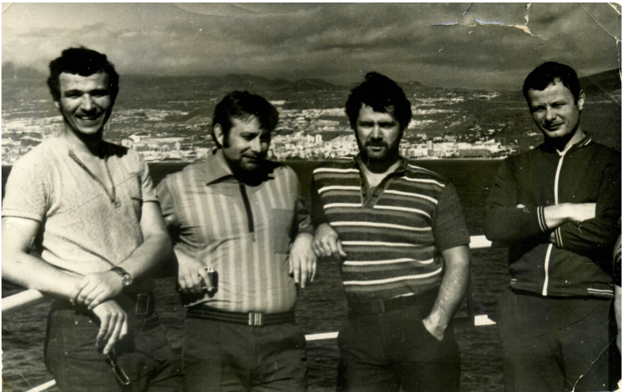
С друзьями на фоне Лас-Пальмаса