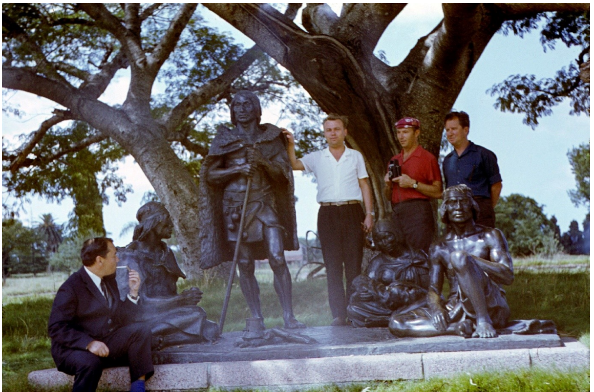
Монтевидео Памятник последнему индейцу.