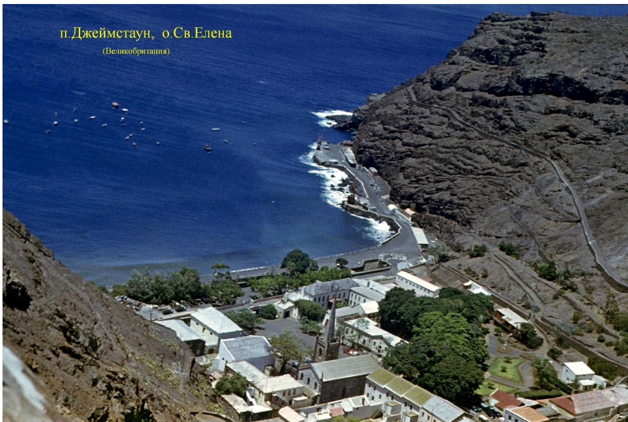
п. Джеймстаун, о.Св.Елена (Великобритания)