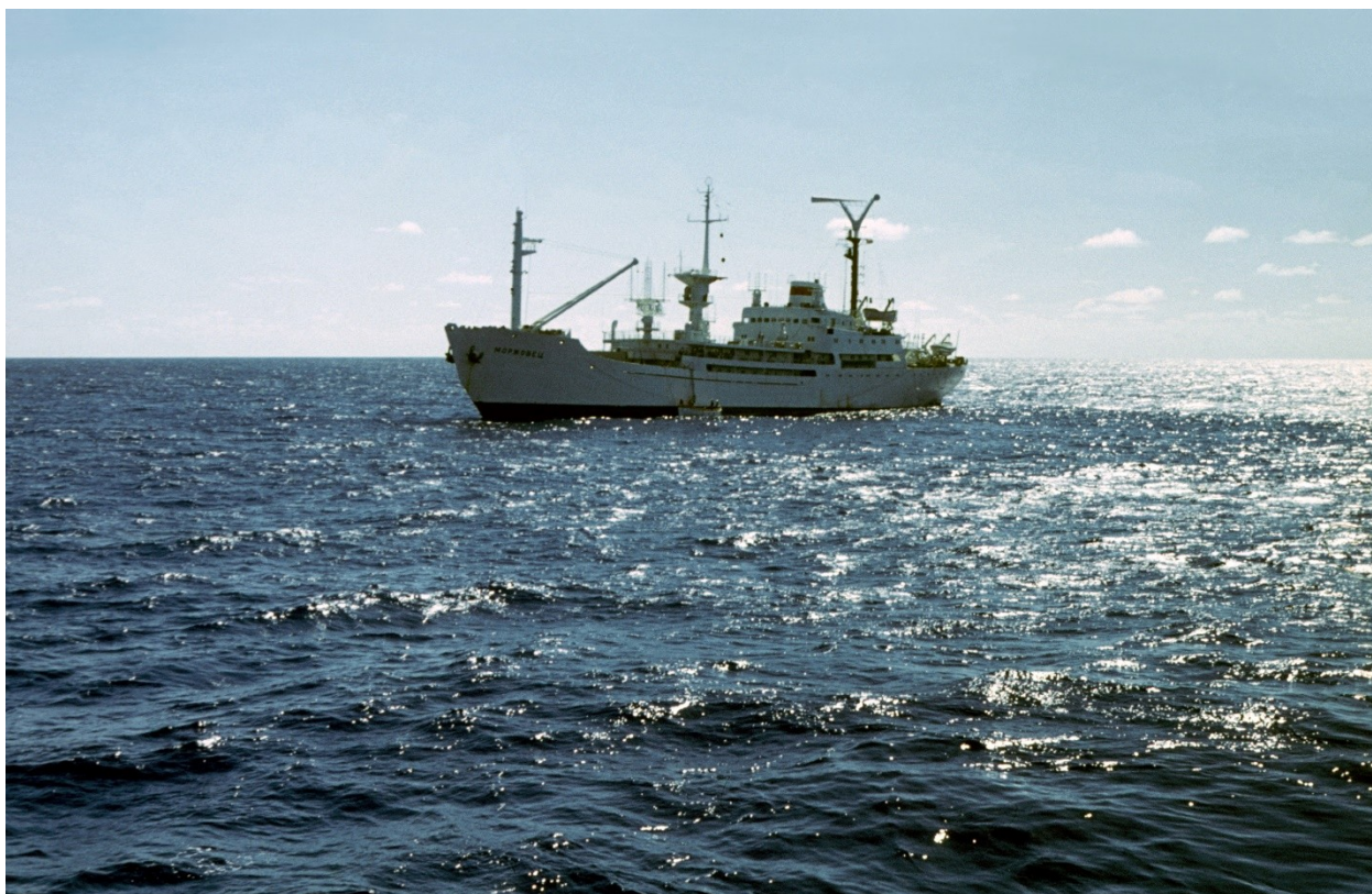
НИС «Моржовец».