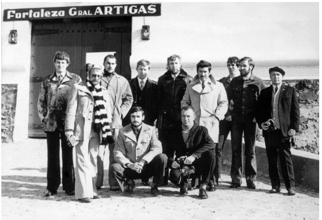
Экскурсия в Монтевидео.