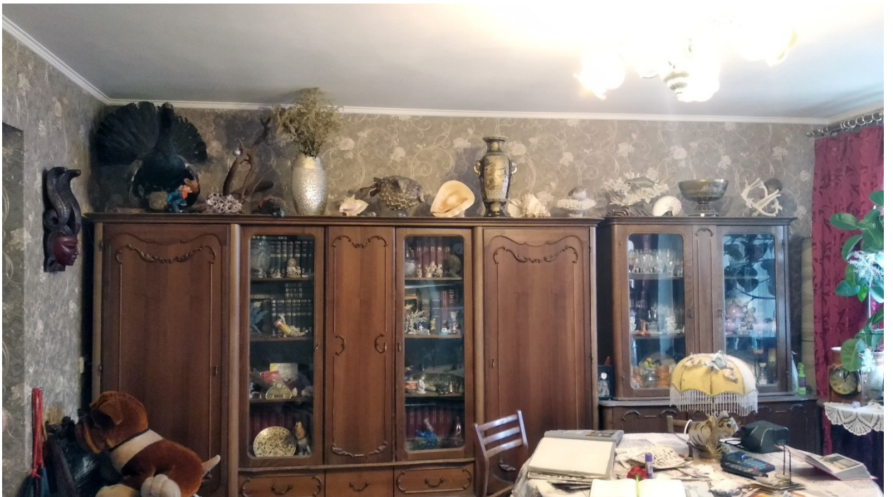
Гостинная В.П. Левина